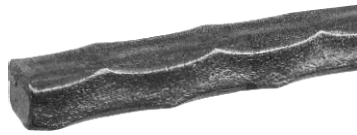
4コーナー樋目風模様入り角棒

記号凡例 ↑高さ ↔巾 ↗奥行 ⊥厚み ∅直径 ⊕重量 ≠使用材 ★取寄せ扱い品