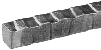
4面端打風模様入り角棒