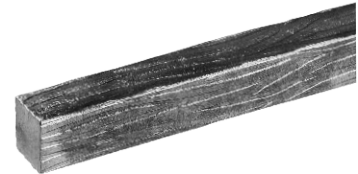
4面木目風模様入り角棒