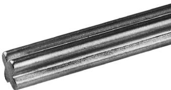
異型(丸棒が4本癒着した形)